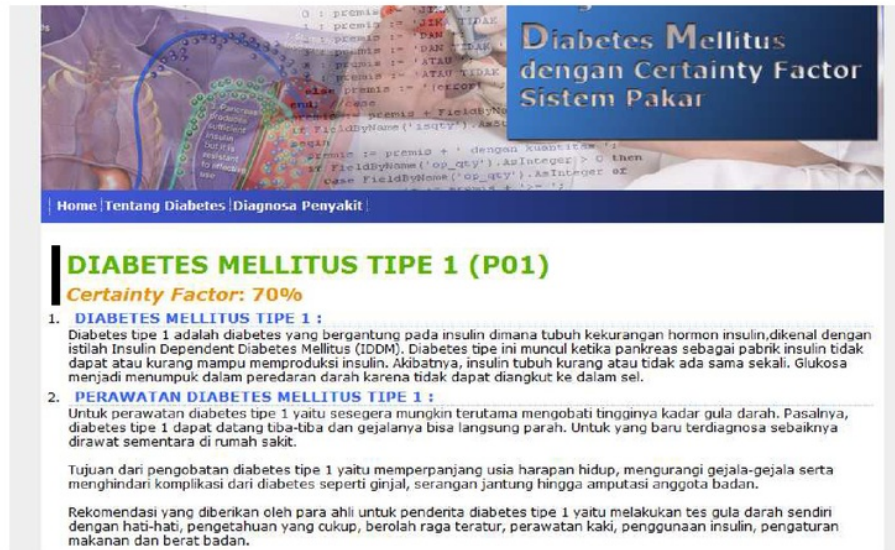
Gambar 4. Hasil Konsultasi

Perhitungan CF_{\text{sequential}} tersebut menghasilkan presentasi keyakinan sebesar 70%. Pada gambar 4, presentase keyakinan yang diperoleh dari hasil perhitungan yang dilakukan oleh sistem, juga menghasilkan nilai 70%. Hal tersebut membuktikan bahwa implementasi metode Certainty Factor pada sistem tersebut telah dilakukan dengan benar.